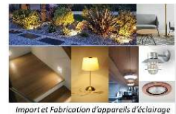
Import et Fabrication d'appareils d'éclairage